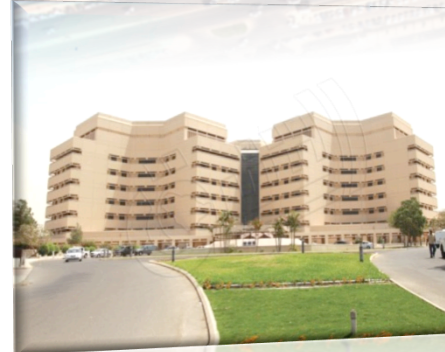
KING FAHAD GENERAL HOSPITAL